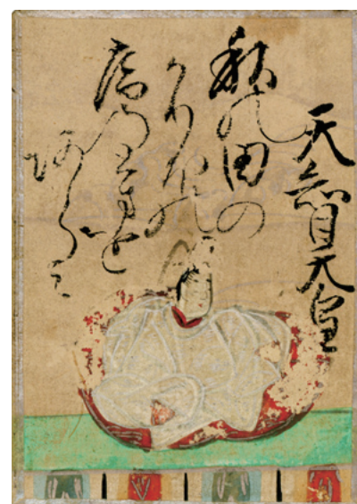
1 天智天皇 上の句